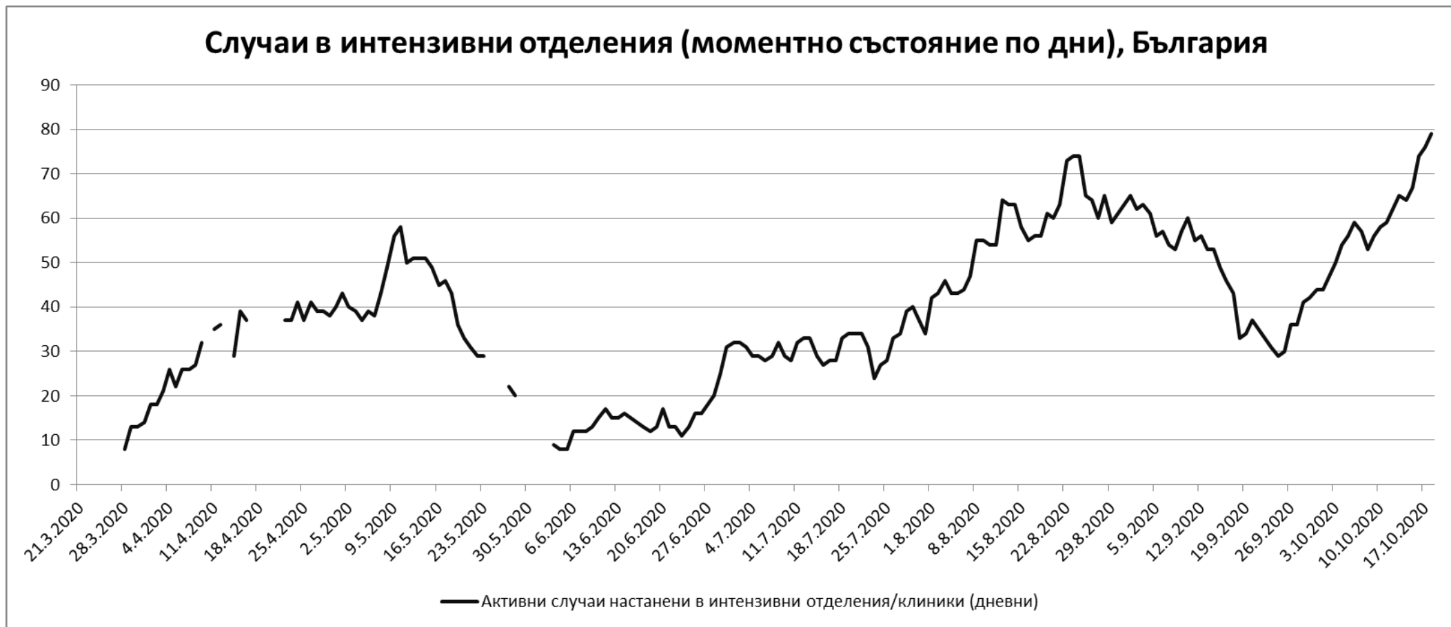
Случаи в интензивни отделения (моментно състояние по дни), България